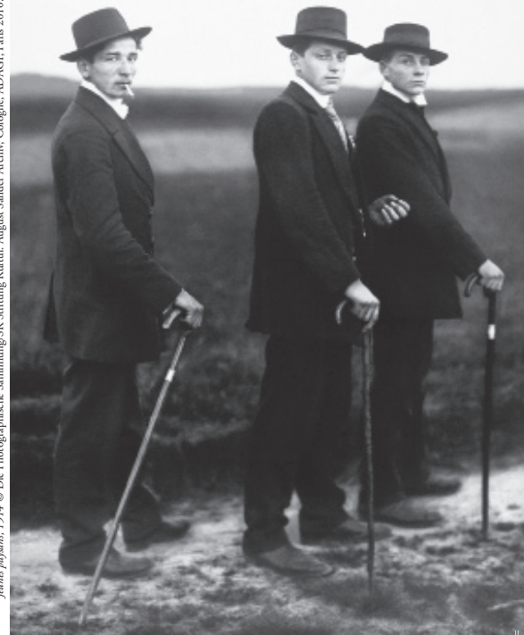
Janus paysans, 1914